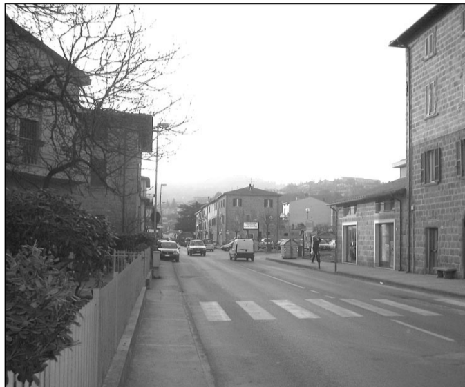
Ponte Felcino, la zona di Perugia dove ha sede la società fantasma

All'accaduto si è interessato anche il noto giornalista televisivo Antonio Lubrano, consulente della Unimedia Group, nel-